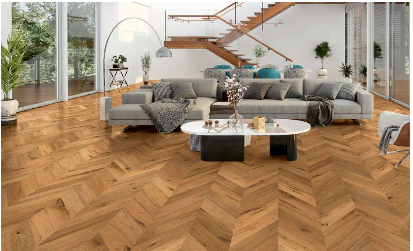
AMADEUS Franz. Fischgrat Eiche Rustikal, oxy geölt