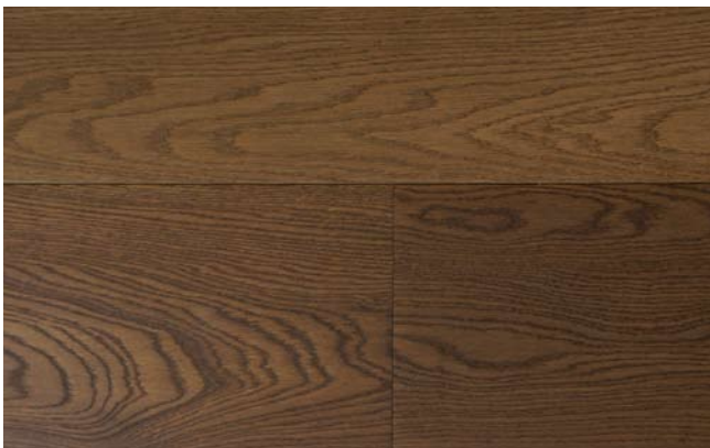
oxy braun geölt