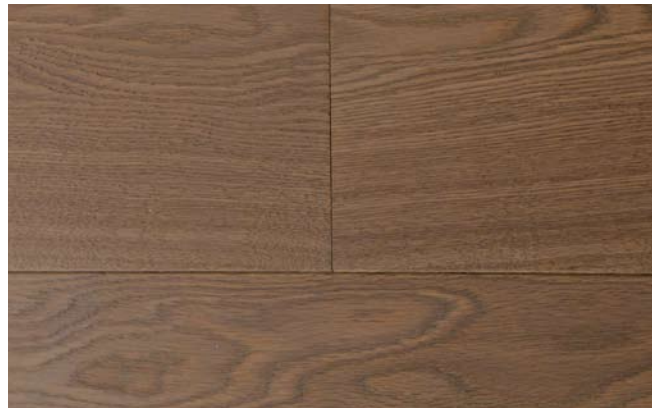
oxy grau geölt