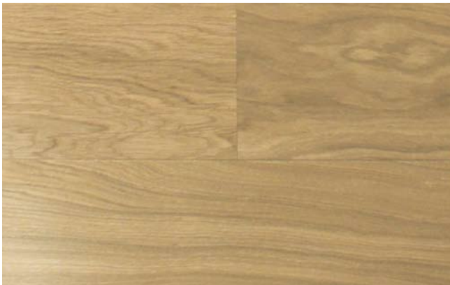
oxy weiß geölt