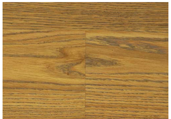
Eiche Frost & Fire