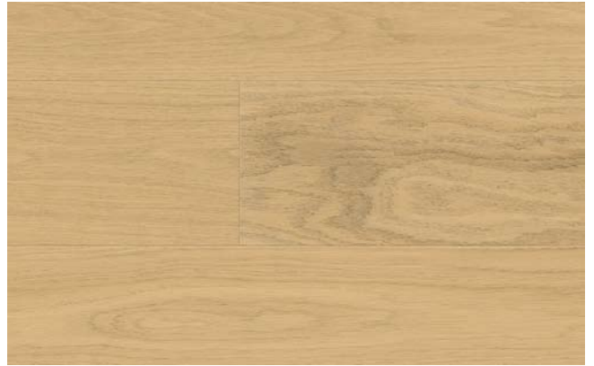
oxy leicht weiß geölt