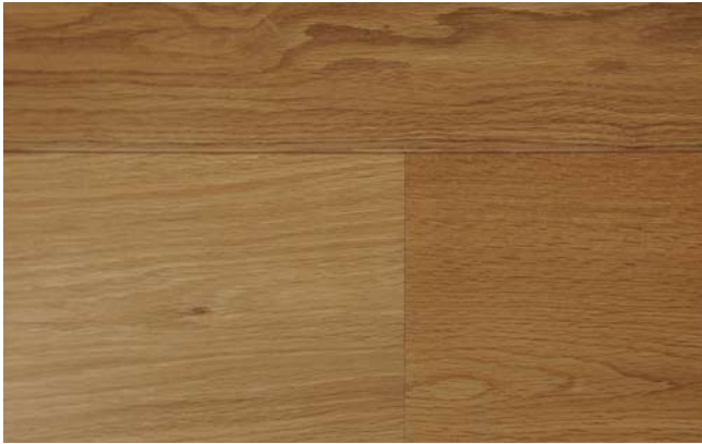
oxy natur geölt