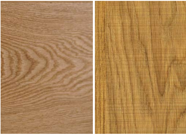
Zusätzlich Bürstung/Sägerau möglich