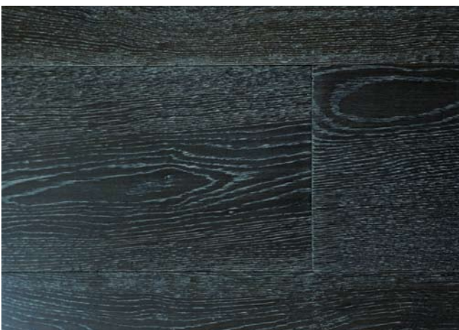
Eiche Black & White