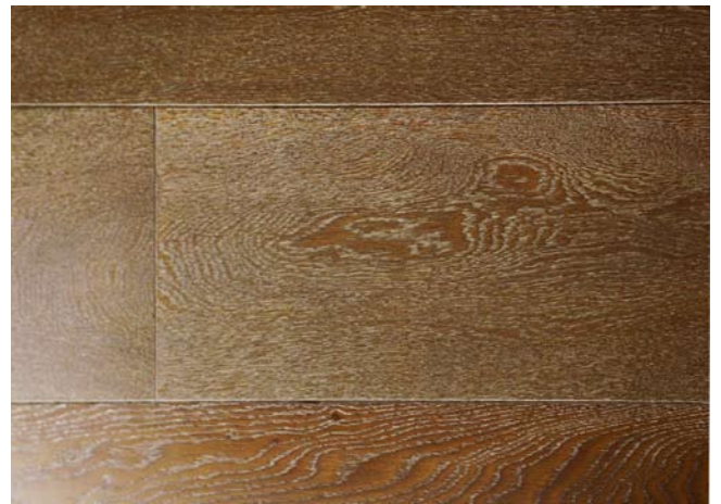
Eiche Earth & Snow