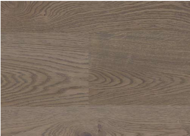
Eiche Shabby Grey