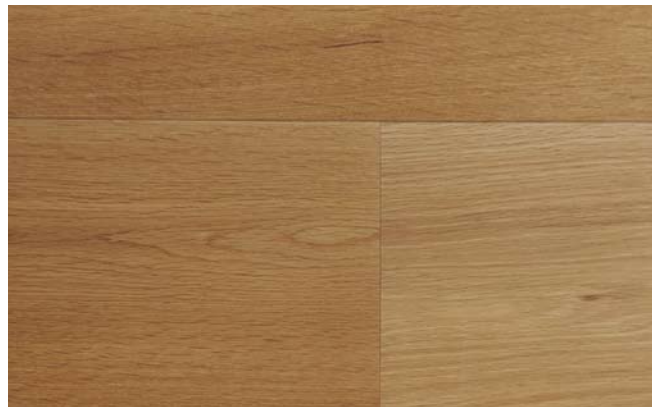
matt lackiert / Top endgeölt