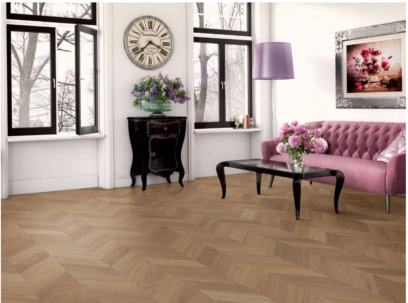
AMADEUS Franz. Fischgrat Eiche Natur, oxy grau geölt

Amadeus Französisch Fischgrat gibt es mit drei verschiedenen Oberflächen: versiegelt, top-endgeölt und oxidativ-geölt.