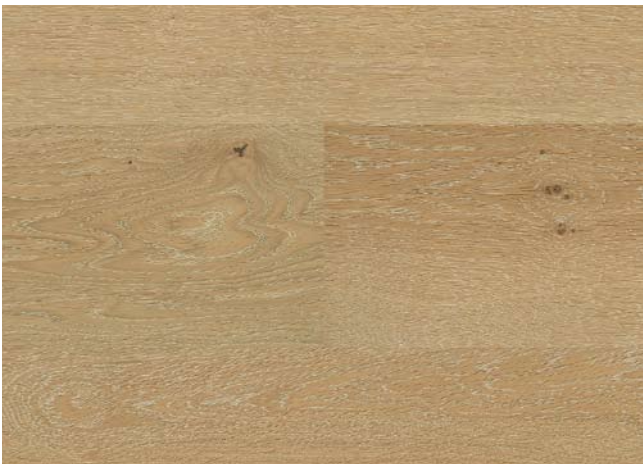
Eiche Milk & Honey