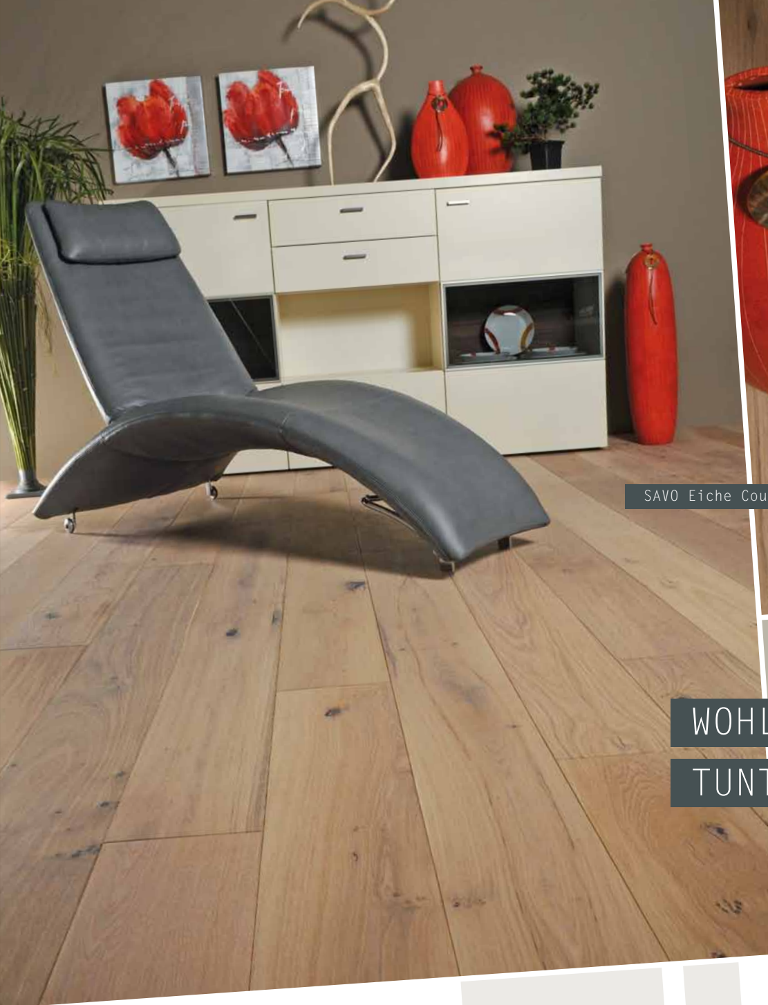
SAVO Eiche Country, oxy weiß geölt