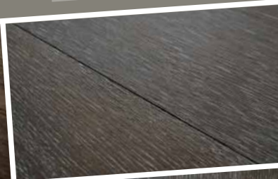
black & white