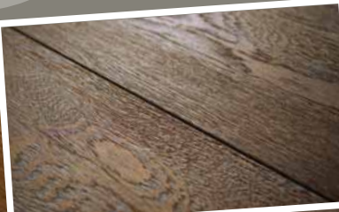
earth & snow