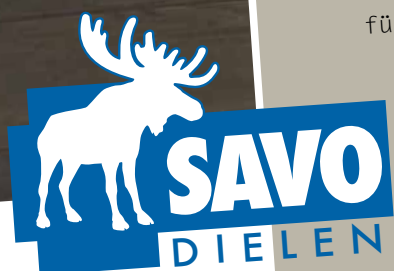
SAVO Räuchereiche Naturell, oxy natur geölt

Die dunkle Räuchereiche strahlt eine unglaubliche Würde und Schönheit aus. Harmonische Farbschattierungen auf der Oberfläche und der elegante Dunkelton machen aus dem Parkett ein Schmuckstück für Ihr Zuhause. Besonders moderne und klare Möbel bilden einen schönen Kontrast zum Boden. Die Savo Dielen sind längsseitig leicht angefast, damit sich die einzelnen Elemente schön voneinander abheben. Parkett bietet viele Vorteile. Um nur einige zu nennen: Holz ist ein natürlicher Stoff und reguliert die Luftfeuchtigkeit im Raum. Dies trägt zu einem idealen Raumklima bei. Staub und Bakterien haben bei einer normalen Pflege des Parkettbodens keine Chance: ein echtes Plus, nicht nur für Allergiker.