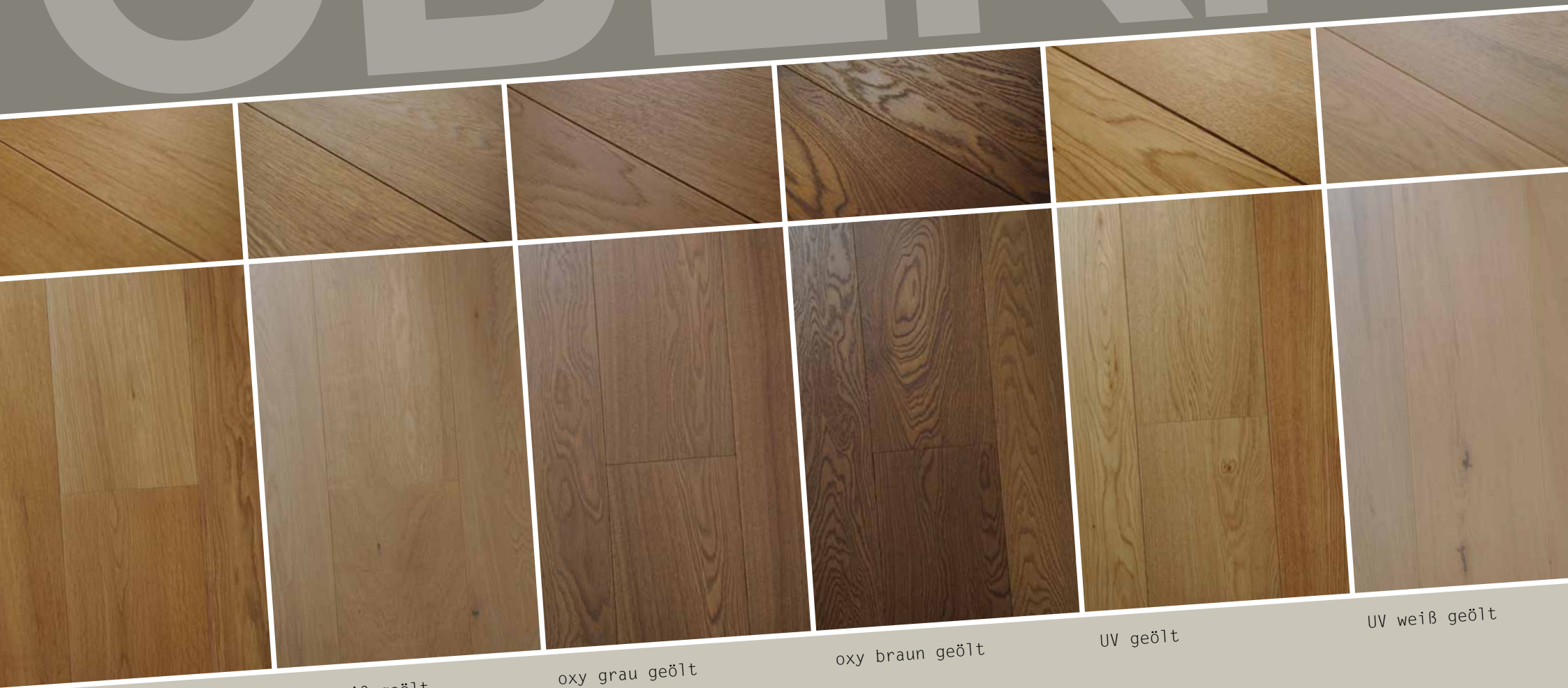
oxy natur geölt