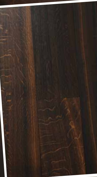
SAVO Eiche Naturell