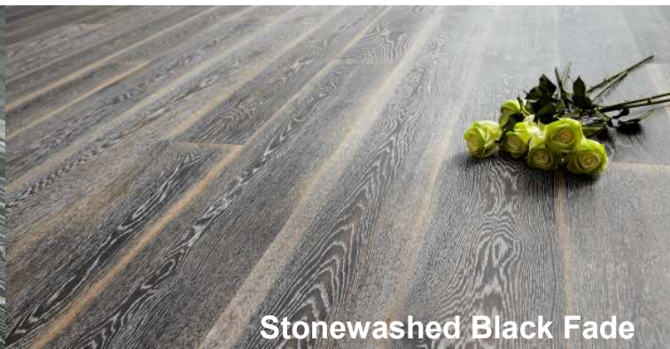
Stonewashed Black Fade