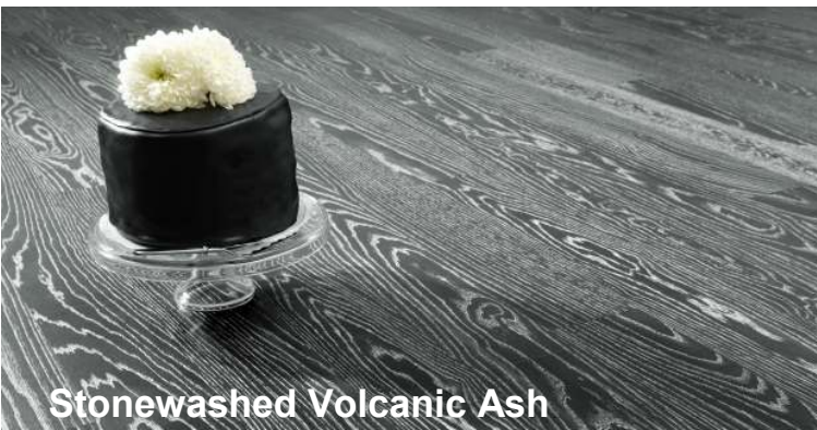
Stonewashed Volcanic Ash